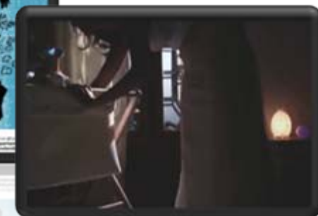
Materials web Gencat: Cartell Vídeo Auca (adaptable)