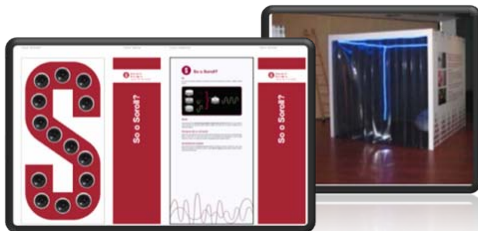
Exposició adéu soroll, Diputació Barcelona