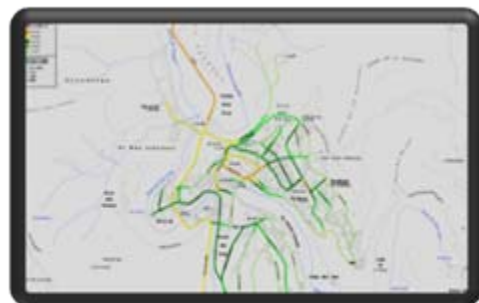
Mapes de soroll i plans d'accions