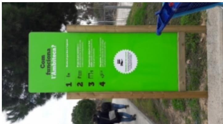
Visita tècnica ECONOMIA CIRCULAR I CIUTADANIA a l'AMBITECA de Sant Cugat del Vallès