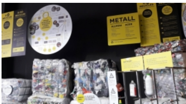
Visita tècnica ECONOMIA CIRCULAR I CIUTADANIA a l'AMBITECA de Sant Cugat del Vallès