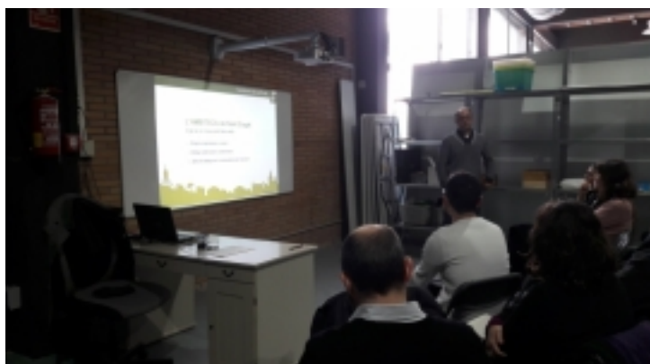
Visita tècnica ECONOMIA CIRCULAR I CIUTADANIA a l'AMBITECA de Sant Cugat del Vallès