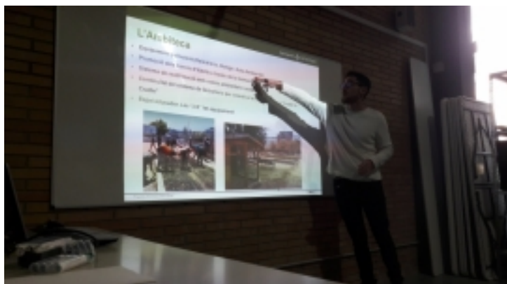
Visita tècnica ECONOMIA CIRCULAR I CIUTADANIA a l'AMBITECA de Sant Cugat del Vallès