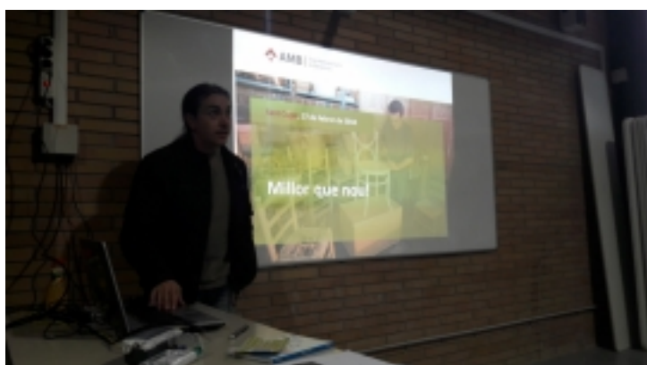
Visita tècnica ECONOMIA CIRCULAR I CIUTADANIA a l'AMBITECA de Sant Cugat del Vallès