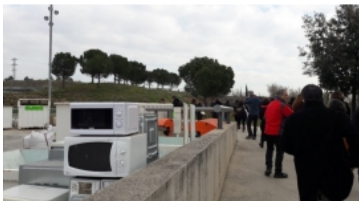
Visita tècnica ECONOMIA CIRCULAR I CIUTADANIA a l'AMBITECA de Sant Cugat del Vallès