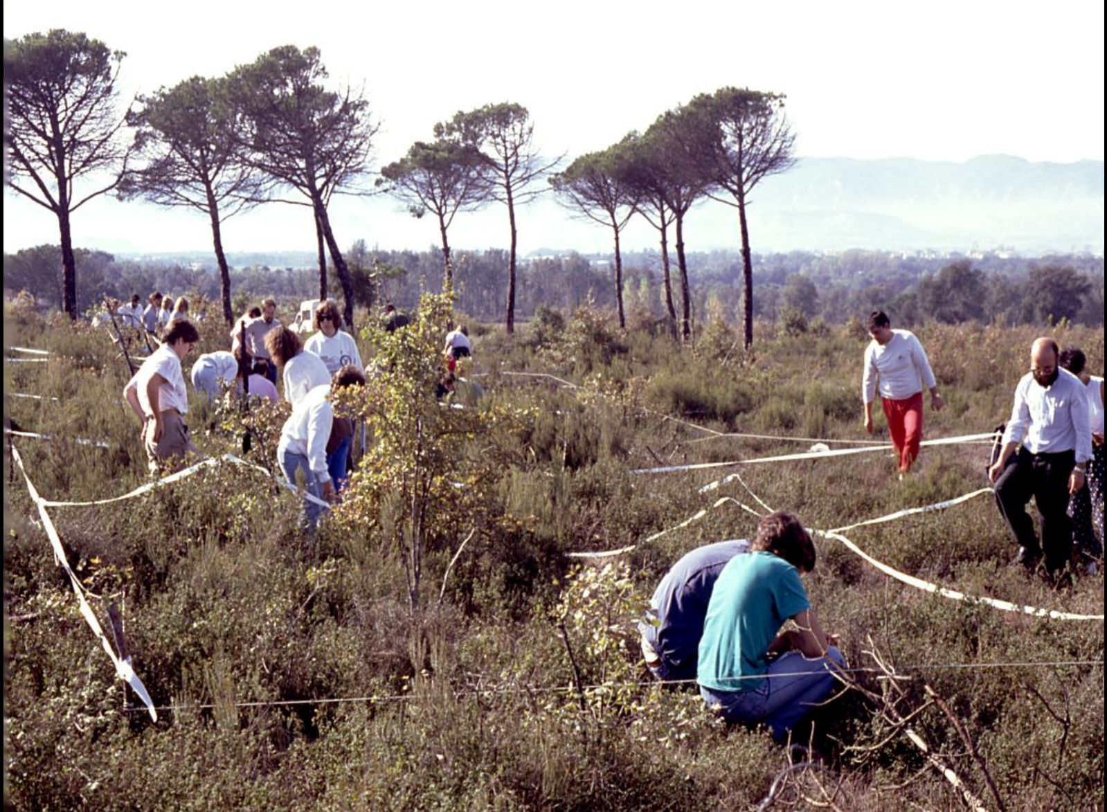
'El foc al bosc', formació d'equips voluntaris. Centre EA La Serra, Osona, tardor 1987