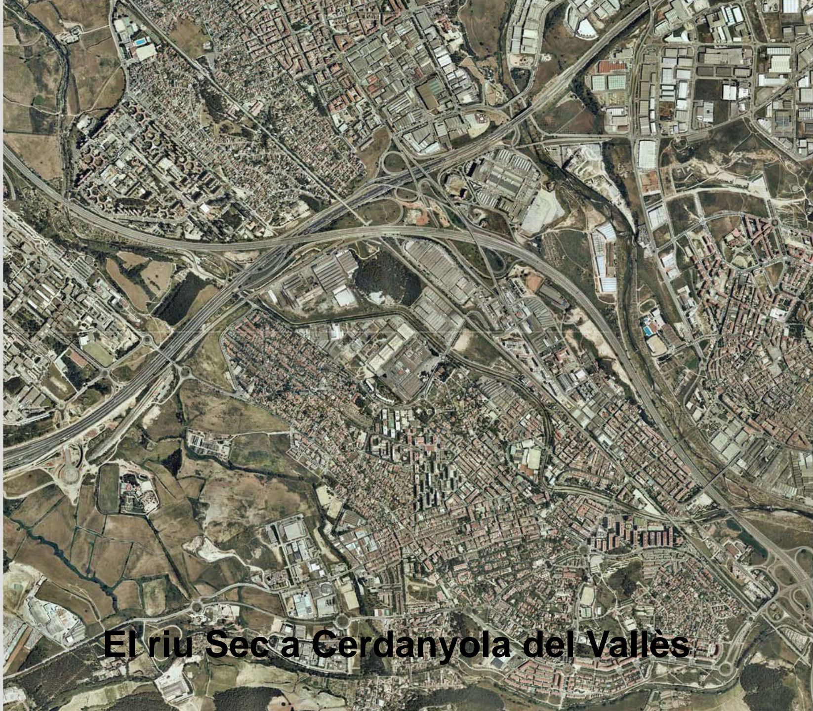
El riu Sec a Cerdanyola del Vallès