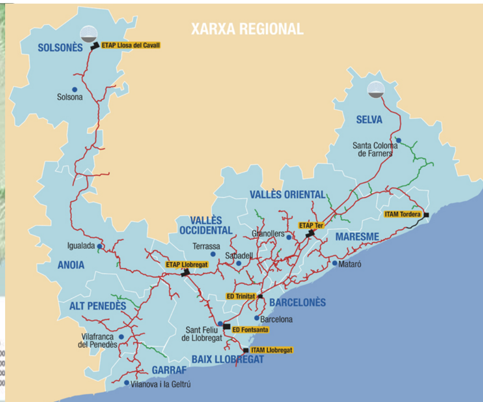
Geolocalització de la Tordera en el sistema de distribució Aiguës Ter Llobregat.