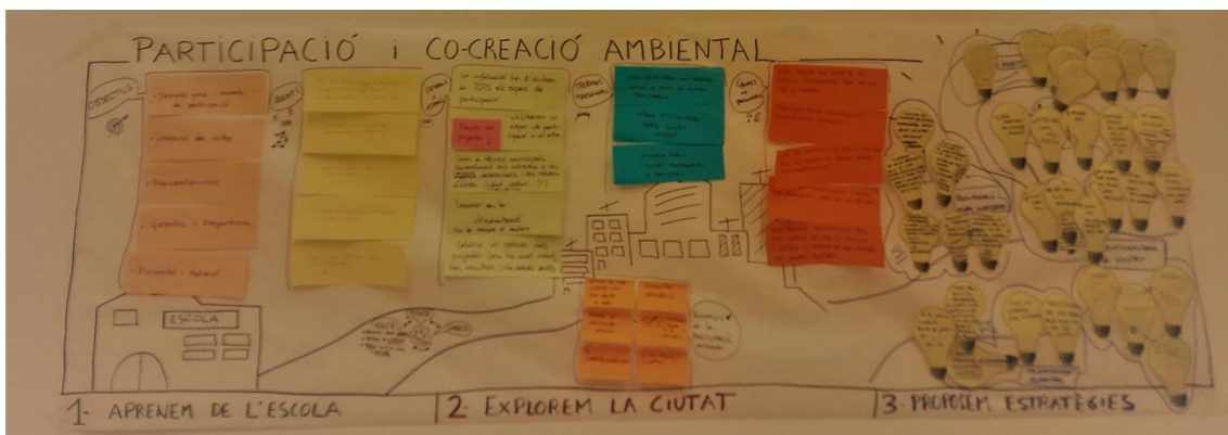
Itinerari de reflexió del taller de participació i co-creació ambiental i conclusions dels grups

Es van organitzar cinc grups de treball, cadascun dels quals va aprofundir en un dels cinc elements d'anàlisi i van dissenyar una estratègia creativa per estimular la participació en un projecte ambiental a la ciutat.