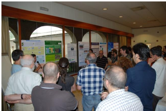
Juliol de 2013