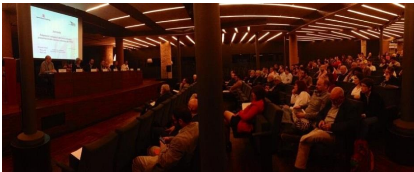
Presentació del 5th IPCC AR (WG II and III) – Barcelona, 29/4/14