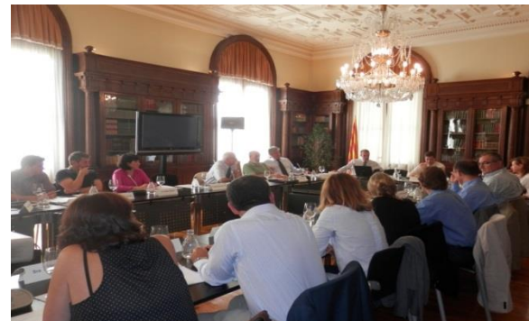
Workshop de Canvi Climàtic i Turisme Octubre de 2014