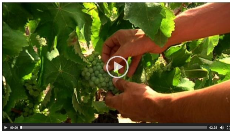
La DO Penedès espera una verema marcada per la sequera d'aquest estiu